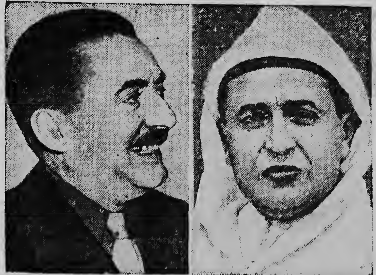
KOLONEL AUGUSTIN GUILLAUME (links) de Franse Resident Generaal in Marokko bracht onlangs een bezoek aan Parijs. Dit bezoek had vooral voor Sultan Sidi Mohammed Ben Youssef ernstige gevolgen. De Sultan moest het land verlaten, en werd door de Fransen beschuldigd van het ontketenen van een opstand, welke 20 personen het leven kostte.

Op het zware parcours waren de prestaties van de Nederlandse amateurs slechts matig; zij reden een "lijdzame" wedstrijd zonder initiatief en zonder overtuiging.